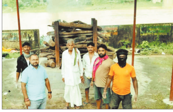
अंतिम संस्कार में शामिल पार्षद व मोहल्लेवासी।